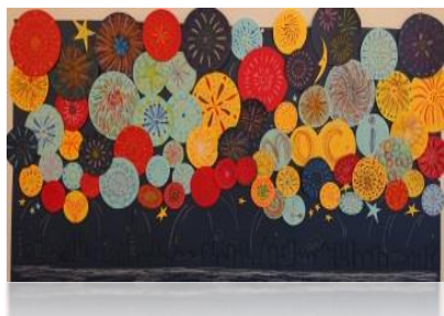
美術同好会の共同作品「花火」