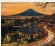
▲富士忍野グランプリフォトコンテスト作品