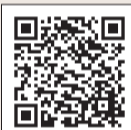
▲口座振替の申し込みについて

6月15日までに申し込んだ場合は、第1期分からの引き落としです。口座名義人本人がサービス対象の金融機関（みずほ・三菱UFJ・三井住友・りそな・ゆうちょ銀行、西武信用金庫）のキャッシュカードを受付窓口（納税課・区民課〈第1・3・5土曜日のみ〉・区民事務所）に持参すれば、口座振替の申し込みができます。金融機関届出印は不要です。