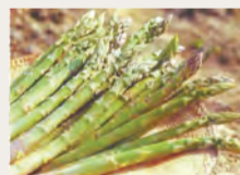
▲北海道名寄市のアスパラ