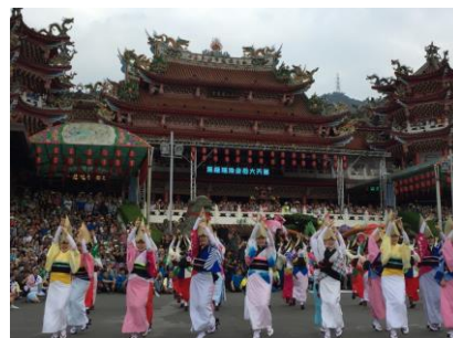
東京高円寺阿波おどり台湾公演 2019 の様子

一般財団法人杉並区交流協会と連携し「東京高円寺阿波おどり台湾公演」（5 月）及び「国立台湾戯曲学院杉並公演」（11 月）を実施し、区と台湾との相互交流を推進します。