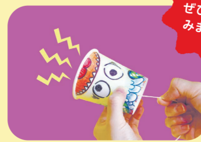
▲ハロウィンカップ