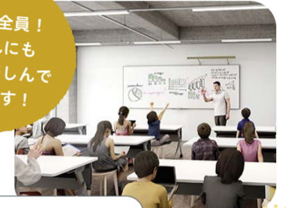
実験室・ワークショップルーム