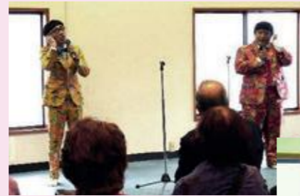
いち・もく・さん