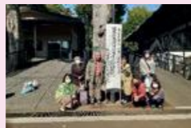
実行委員の皆さん