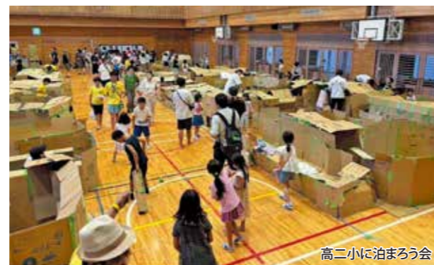
高二小に泊まろう会