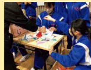
中学生コーナー(ひもくじ)