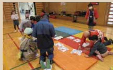
みてみてステージ

1月24日(土)に方南小学校の体育館で伝承遊び市を実施しました。関係者も含め101人が参加して昔遊びを楽しみました。「みてみてステージ」では、けん玉、コマ、お手玉、あやとりの技が3級以上合格した子どもが技を発表する時間があり、観ている人もドキドキでした。