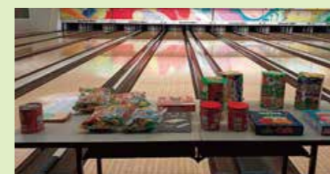
みんなで集合写真を撮影! 良い体験になったかな?