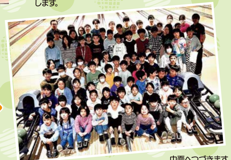
中面へつづきます。