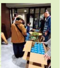
飲み物をもらって入場します。