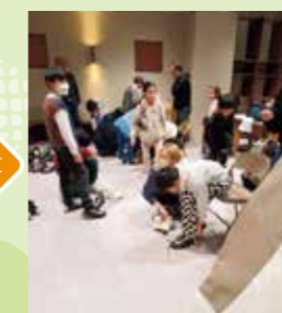
サイズに合ったボウリング専用靴をかりて履き替えます。