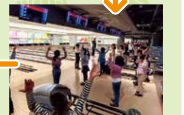
怪我をしないようにみんな準備運動!