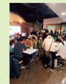
受付を済ませます。

3/1(日)9:00~12:00 笹塚ボウルにてボウリング教室を行いました。参加人数は小学生82人(和泉学園小学校34人、方南小学校25人、大宮小・中学校24人、うち1人早退)でした。現地集合・解散でした。和気藹々と無事開催することができました。運営委員の皆さま、笹塚ボウルの職員の皆さま、大変お疲れ様でした。