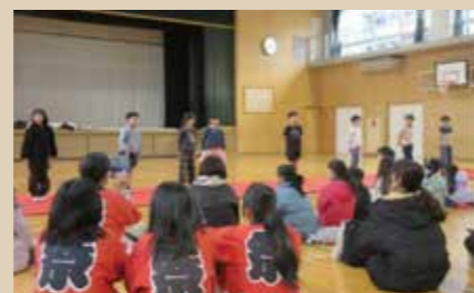
地域の人と福笑いのチャレンジ