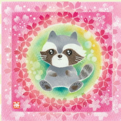
あらいぐまのお花見