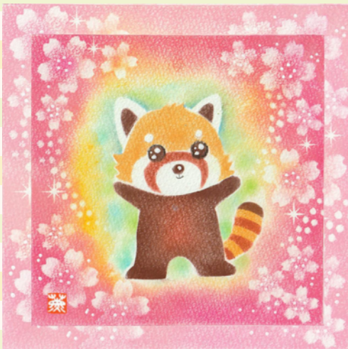
レッサーパンダの春