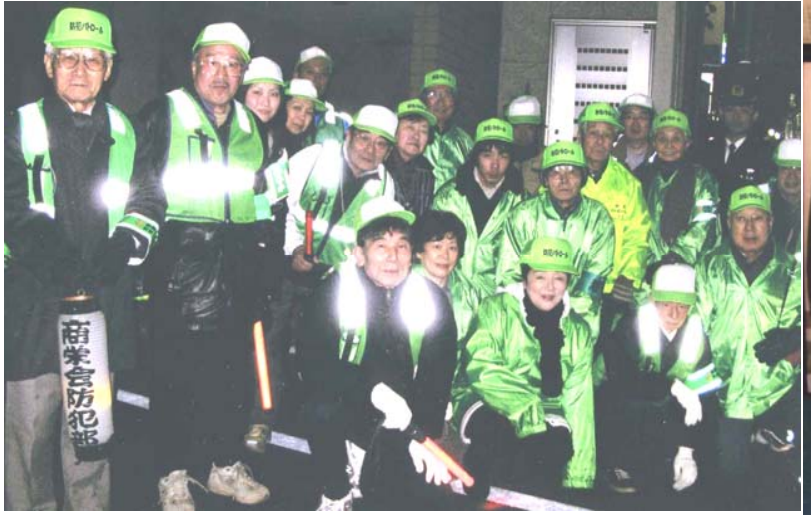
川南町会・荻窪1・2丁目商業会合同パトロール

防犯自主パトロール隊の皆様の活動状況(パトロールの写真・標語等)をこのページで紹介させていただいております。ご希望のパトロール隊は、ご連絡ください。