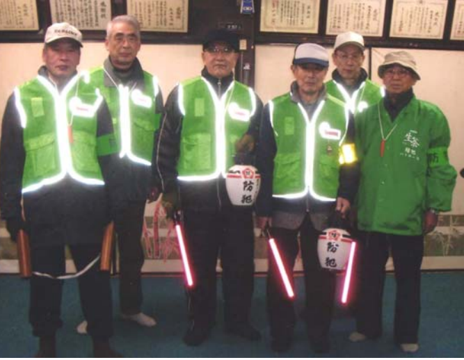
松庵町会パトロール隊