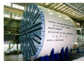
シールドマシンイメージ