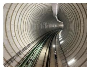
トンネルイメージ