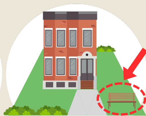
共同住宅の オープンスペース