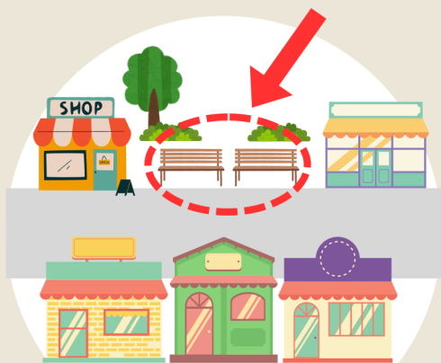
商店街の 空きスペース