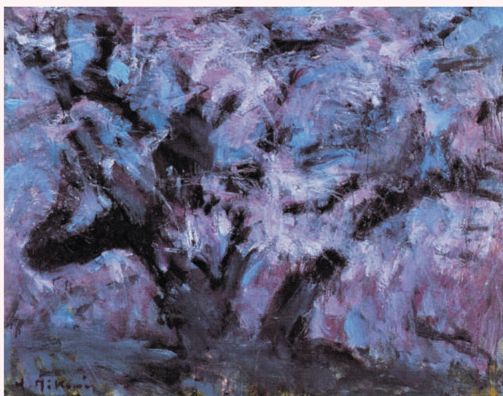
三上 浩「謳う」(平成16年、三上家所蔵。画像は『風と大地の協奏-三上浩展』〈北九州市立美術館、平成19年〉38頁より転載)