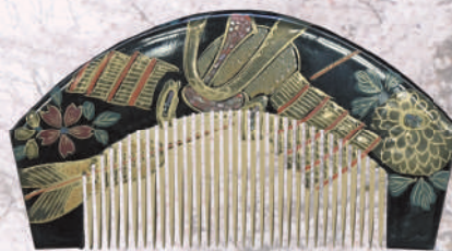
桜の描かれた櫛(昭和初期頃)