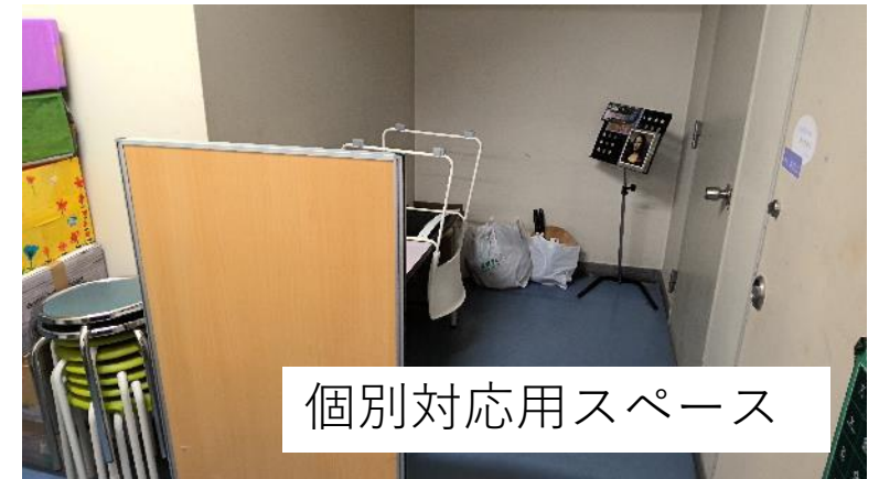
個別対応用スペース