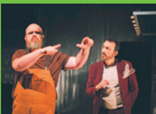
「オン・ザ・エッジ」(2024年)

ろう者を中心に劇場全体が「手話のまち」となる芸術祭が計4日間にわたって開催されます！演劇、パフォーマンス、イマーシブシアター、映画に、バトルに、トーク企画まで、多彩なろう芸術が展開されます。また、会期中には劇場前駐車場スペースにて、手話をテーマにした食べ物や雑貨を販売する「手話の市」が同時開催！ぜひお立ち寄りください。