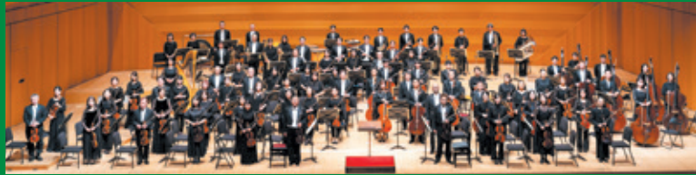
日本フィルハーモニー交響楽団

園 杉並公会堂大ホール 全席指定 / S席5,300円 / A席4,200円 / B席3,100円 園 杉並公会堂 ☎5347-4450(11:00~18:00) 【チケット取扱】オンライン 窓 託児