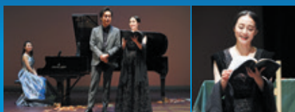
『トロイメライ』(2024年)