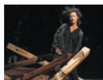
『共犯的戯レゴト』(2024年)