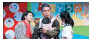
『シングルファーザーになりまして。』(2024年)

なみちけ 「なみちけ」利用できます お得で便利な座・高円寺発行ステージ引換回数券です。座・高円寺で購入・利用することができます。演目、公演時間、託児などは座・高円寺チケットボックス ☎3223-7300へ。※電話・窓口ともに月曜日定休