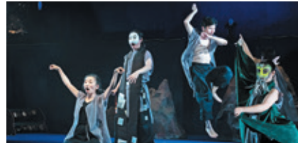
『新版 小栗判官・照手姫』(2023年)