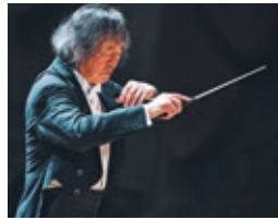
小林研一郎

園 小林研一郎(指揮) 日本フィルハーモニー交響楽団(管弦楽) 曲 J.シュトラウスII: ワルツ《美しく青きドナウ》 J.シュトラウスII/ヨーゼフ・シュトラウス: ピツィカート・ポルカ スメタナ: 交響詩《モルダウ》 ドヴォルジャーク: 交響曲第9番《新世界より》