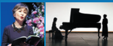
『ジョルジュ』(2024年)