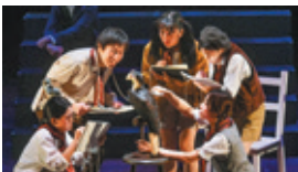
『さようなら、シュルツ先生』(2024年)