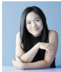
河村尚子