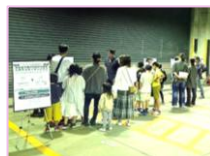
オープンハウスのイメージ (旧杉並中継所の跡地活用に関する取組：令和7年10月)

また、令和8(2026)年度には、ワークショップで作成した更新方法（たたき台）に関するオープンハウスのほか、子どもたちへの意見聴取を実施するなど、ワークショップ参加者以外の意見も聞きながら検討を進めていく予定です。