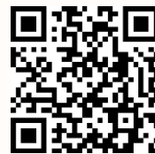
参加申込フォーム