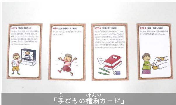
「子どもの権利カード」

こ けんり つか み まわ こ けんり りそう げんじつ かんが 「子どもの権利カード」を使って、身の回りの「子どもの権利」の理想と現実のギャップについて考えたよ！