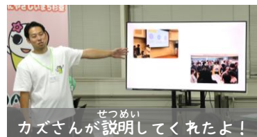
せつめい カズさんが説明してくれたよ！

すぎなみくいがい ちいき こどもとく じれいしょうかい 杉並区以外の地域で、子どもが取り組んでいる事例が紹介されたよ！