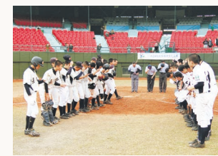
▲交流自治体中学生親善野球大会

国内＝下記8自治体、東京都武蔵野市、東京都小笠原村 海外＝ウィロビー市（オーストラリア）、瑞草区（大韓民国ソウル特別市）、台北市（台湾）、ウズベキスタン、パキスタン