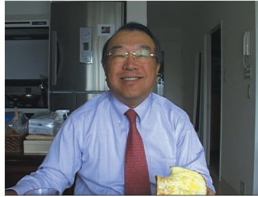
▲映画のワンシーン