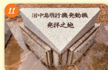
11 中島飛行機製作所東京工場 (桃井原っぱ公園) 桃井3-8-1 中島飛行機製作所は、終戦までに零戦搭載の「栄」などをはじめ、機体25,935機、エンジン46,726基を生産した。