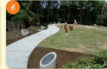
6 与謝野子宅跡 (与謝野公園) 南荻窪4-3-22 日露戦争中に弟を想って与謝野晶子が詠んだ「君死にたまふことなかれ」。晩年、与謝野夫婦が過ごした住居跡地に建てられた公園。