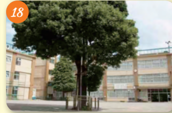
18 かしの木 (杉並第六小学校) 阿佐谷南1-24-21 昭和20(1945)年5月の空襲により杉並第六国民学校は全壊したが、校庭のかしの木は焼け残り、今でも校庭の真ん中で児童たちを見守っている。