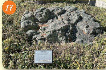
17 嵯峨侯爵邸跡地 (郷土博物館) 大宮1-20-8 嵯峨実勝侯爵の長女・浩は、清朝最後の皇帝愛新覚羅溥儀の弟・溥儀との結婚の際にこの地から出立した。(写真は嵯峨家の庭石)