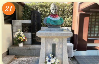
21 チャンドラ・ポースの墓 (蓮光寺) 和田3-30-20 インド独立運動の指導者の遺骨が安置されていることから、記念碑と胸像が建立されている。