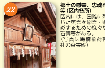
22 郷土の慰霊、忠魂碑等 (区内各所) 区内には、困難に殉じた英霊を慰霊・顕彰するための様々な石碑等がある。(写真は馬橋荷神社の斎堂殿)