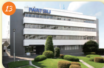
13 旧岩崎学園 (岩崎通信機株式会社) 久我山1-7-41 創業者は青少年教育の重要性を唱え、工場の若い従業員用の学校として開校。戦時中、久我山本社工場にて、電波警戒機の研究、生産を行った。