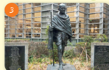
3 マハトマ・ガンジー像 (中央図書館) 荻窪3-40-23 世界平和と相互理解がめめられることを祈念して、インドの慈善団体である「ガンジー修養所再建トラスト」から寄贈された像。インド独立の父。