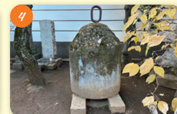
4 コンクリートの釣鐘 (中道寺) 荻窪2-25-1 山門は、鐘楼を兼ねる鐘楼門。安永2(1773)年の上棟。梵鐘は金属回収令により回収され、強固対策としてコンクリート製の鐘を吊るした。