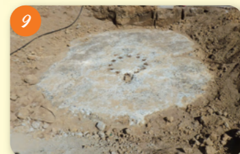
9 高射砲陣地の跡地 (中瀬中学校他) 下井草4-3-29他 米軍の空襲に備えるため高射砲が、久我山、松ノ木、西荻北、下井草に整備されたが、現在、その面影を見ることはない。