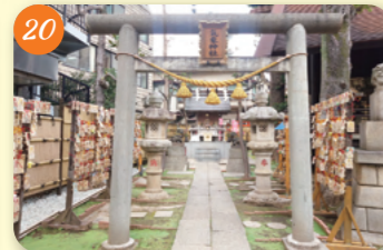
20 気象神社 (高円寺氷川神社) 高円寺南4-44-19 旧陸軍気象部 (馬橋公園) 内にあり、戦後、高円寺氷川神社の末社の社殿とすため移転され、その後、気象神社として独立社殿となった。