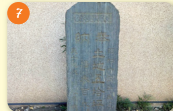
7 支那事変の碑 (天沼八幡神社) 天沼2-18-5 昭和12(1937)年の盧溝橋事件(北支事変)と第二次上海事変を端緒とする日中戦争の当時の呼称。氏子総代が、戦勝祈念として土地50坪などを奉納した。