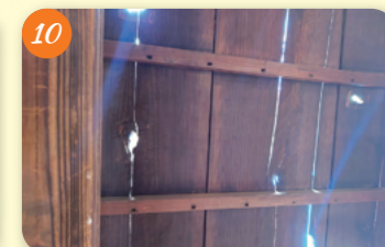
10 焼夷弾による爪痕 (すぎのこ農園) 井草3-19-23 江戸時代中期の建築とされる家宅の部材を活用して作られた農園管理事務所の雨戸には、米軍から投下された焼夷弾による爪痕が残っている。