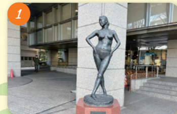
1 ジーンズ・杉並区平和都市宣言像 (杉並区役所) 阿佐谷南1-15-1 区の平和都市宣言 (昭和63(1998)年3月30日) を記念し、「平和」を主題として佐藤忠良氏が制作した作品。