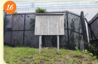
16 旧陸軍弾薬庫 (明治大学和泉キャンパス 永福1-9-1・築地本願寺和田堀跡所 永福1-8-1) 江戸幕府の弾薬庫から陸軍の管轄下におかれた。関東大震災後は明治大学や築地本願寺和田堀跡所となった。