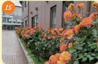
15 アンネのバラ (高井戸中学校) 高井戸東1-28-1 「アンネの日記」を学習した生徒の希望により、アンネの父から高井戸中学校へ贈られた。3株のバラは、地域の方や生徒が中心となって、多くの花を咲かせるまでに育っている。