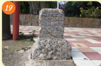
19 軍用地境界線 (馬橋公園) 高円寺北4-35-5 中野駅北口付近は、明治時代に陸軍鉄道大隊、陸軍電信連隊が配置され、訓練地の境界として「陸軍用地」と刻んだ石柱を置いた。