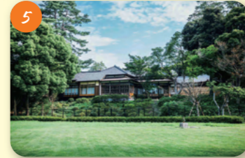
5 近衛文麿旧宅 (荻外荘) 荻窪2-43-36 昭和戦前期、第二次近衛内閣の基本方針を話し合った「荻窪会談」や、対米開戦を回避するための「荻外荘会談」などの場となり、首相官邸の役割も果たしていた。