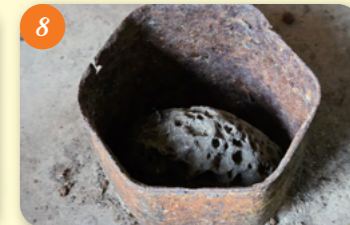
8 焼夷弾の花立 (民間信仰石塔) 清水2-15-7 左右の石塔は右側が笠付角柱庚申塔、左側が角柱型廻国供養塔。この中にある花立はこの辺りに落ちた焼夷弾の残骸を使用している。