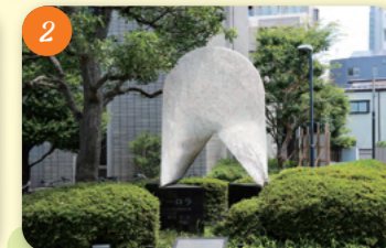
2 「オーロラ」の碑 (荻窪体育館) 荻窪3-47-2 原水爆禁止署名運動の発祥の拠点となった公民館の歴史をとどめ、永遠の平和を希求して建立された。瀧徹氏による作品。館内に写真パネルなどの展示あり。