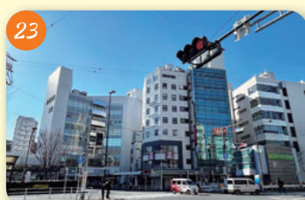
23 建物疎開 (JR中央線4駅周辺) 防火上の対策として内務省令により、建物疎開が実施される。阿佐ヶ谷駅周辺などの駅が対象。駅周辺は、戦後もなく飲食店やマーケットなどが開設された。