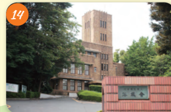
14 旧陸軍中央特種情報部 (浴風会) 高井戸西1-12-1 特殊情報部として陸軍に接収された。広島に原爆を投下するためにB29がテニアン島を飛進したことも、ここで傍受したと言われている。