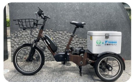
カーゴバイクの実証実験