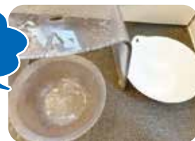
バスグッズ洗浄後