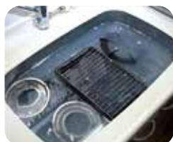
シンクに漬け置きした五徳