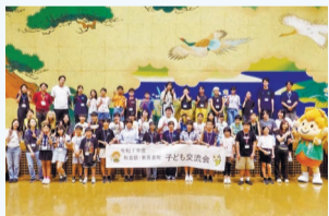
▲東吾妻町子ども交流会