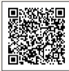
▲Web口座振替受付サービス

6月10日までの申し込みは第1期分から、8月10日までの申し込みは第2期からの引き落としです。書類の記入や金融機関届出印は不要です。