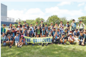
▲名寄市子ども交流会

時 場 右表のとおり 対 区内在住の小学5・6年生で全日程および親子説明会に参加できる方(過去に同交流会・杉並区名寄自然体験交流に参加した方を除く) 定 各16名(各学年8名程度。抽選) 申 詳細は、区HP(右下2次元コード)参照/期間=5月23日～6月7日 問 児童青少年課事業係 ☎3393-4760 他 次世代育成基金活用事業に参加経験のない方を優先