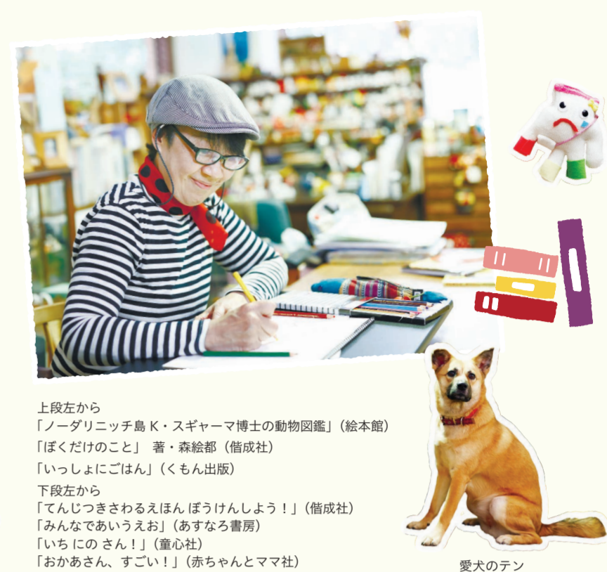
上段左から 「ノードリニッチ島 K・スギヤマ博士の動物図鑑」(絵本館) 「ぼくだけのこ」 著・森絵都 (偕成社) 「いっしょにごはん」(くもん出版) 下段左から 「てんじさきさわるえほん ぼうけんしよう!」(偕成社) 「みんなであいうえお」(あすなろ書房) 「いちにのさん!」(童心社) 「おかあさん、すごい!」(赤ちゃん和妈妈社)