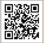
▲健康づくり応援店