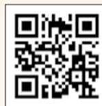
▲杉並区スポーツ 振興財団HP