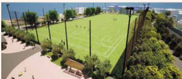
▲スポーツコートの完成イメージ