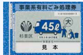
▲事業系有料ごみ処理券新券