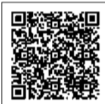
5年度に寄せられたご意見・ご要望（杉並区基本構想〈4年度策定〉の実現に向けた分野ごとの将来像別）

区政へのご意見・ご要望などは、区ホームページ（下2次元コード）・ふれあい通信（区長へのはがき）・郵送・ファクス・電話などからお寄せください。ふれあい通信は、区役所・区民事務所・地域区民センターなどに配置してあります。