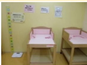
おむつ替えコーナー