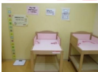
おむつ替えコーナー