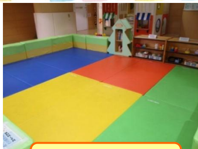
赤ちゃんコーナー