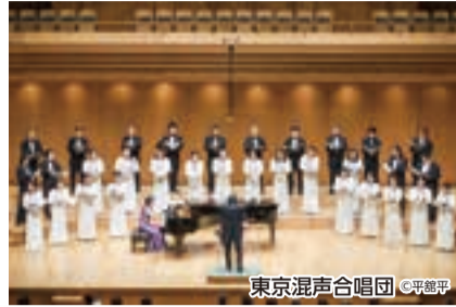
東京混声合唱団