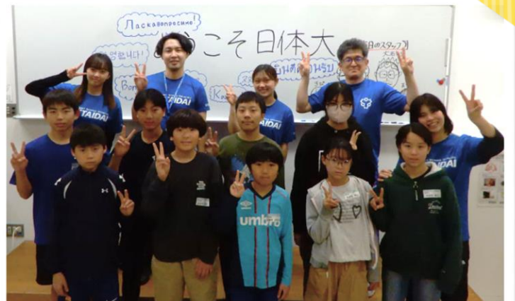
スポーツアナリスト