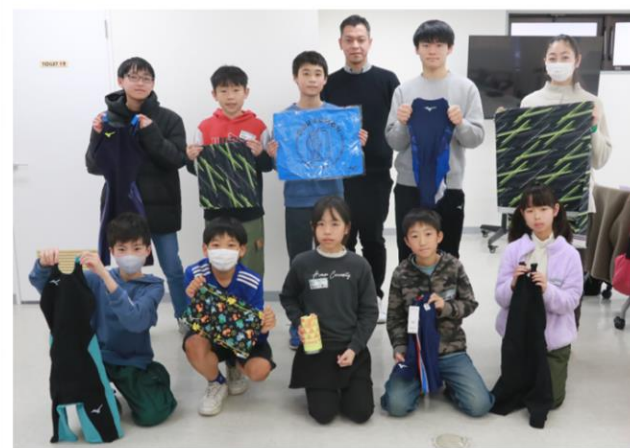
スポーツウェアの商品企画