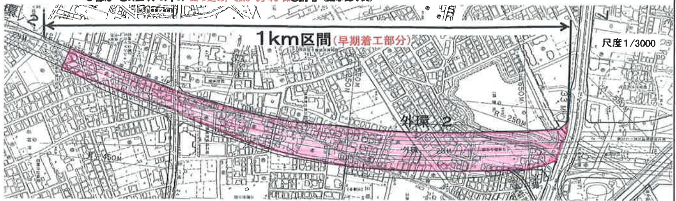
(下段図) 大泉周辺「外環の2」のみに 掛かるエリア (極めて狭い)・・・色部分