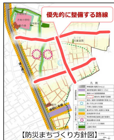
【防災まちづくり方針図】

方南一丁目地区防災まちづくり計画では、3つの路線を「優先的に整備する路線」(右図 — )に位置付けています。その3つの路線におけるまちづくりルールについて意見交換します。