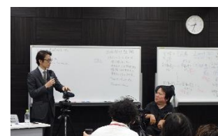
熊谷先生との 対談形式の講義